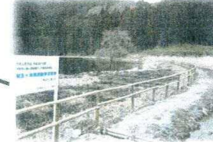
周遊散策道に設置された看板

わたしたちは、平成26年度 宇陀市いきいき地域づくり補助金事業として 龍王ヶ淵周遊散策道整備 をいたしました 向洲地区まちづくり協議会