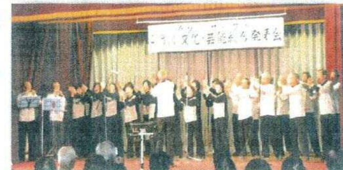
やまびこ合唱団のみなさん

宇陀市の老人会への参加が好評で、再度のゲスト出演依頼、男性コーラスの人数の多さが珍しいようです。歌うことの楽しさが、積極的な練習となり、当日は会場の人たち全員を歌の力で包み込むことが出来ました。