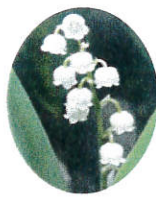
市の花 すずらん 天然記念物 昭和5年11月指定

新年あけましておめでとうございます。2018年は異常気象による酷暑に西日本豪雨、そして台風も多い年で、特に台風21号来襲の際には避難準備、高齢者等避難情報が長時間発令されましたが大きな被害もなく幸いでした。皆様には地域の事業や行事にご理解、ご協力を賜りありがとうございました。これからも、皆様の力をお借りしながら、安心して住み良く、暮らしやすい地域作りに向かって歩いていく所存です。どうかこれからもお力添えを頂けます様、よろしくお祈り申し上げます。また皆様にとってこの新しい年がよりよき年であります様、心より御祈念申し上げます。