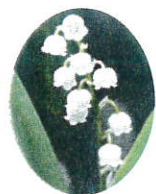
市の花 すずらん 天然記念物 昭和5年11月指定

今年は酷暑が続いたかと思うと勢力の強い台風の襲来、次に雨が続くなど皆様には色々と心配・ご苦労されながらも頑張って、お変わりなくお過ごしのことと存じます。7月～9月の行事情報をお届けいたします。