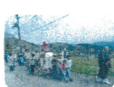
正定寺から高堂へ