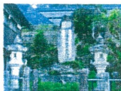
やまびこホール 石段横の碑