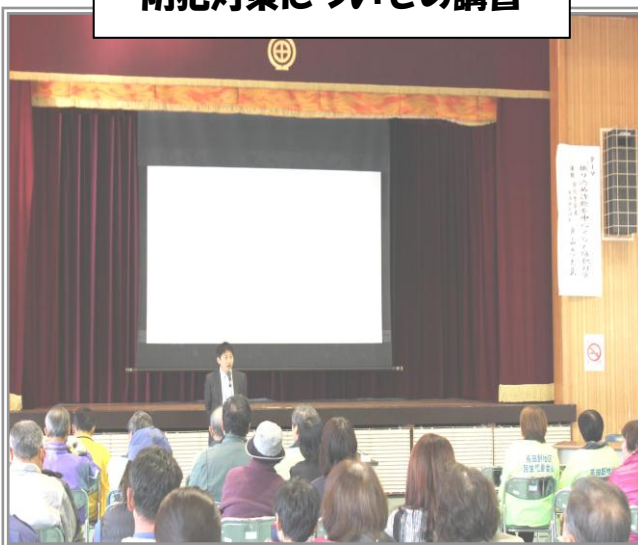
振り込め詐欺などの 防犯対策についての講習