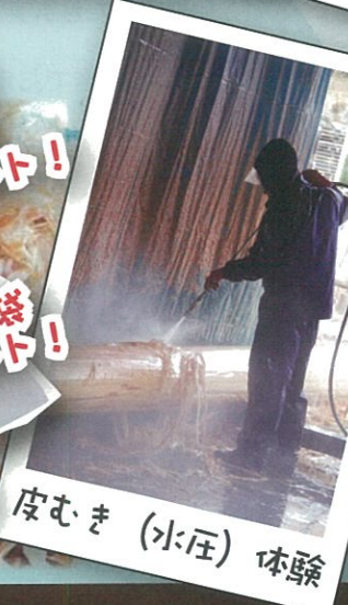
皮むき (水圧) 体験