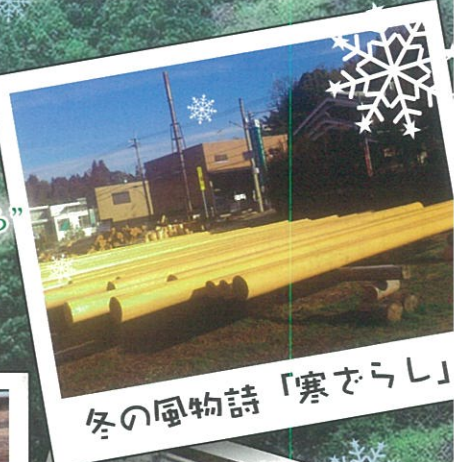
冬の風物詩「寒ざらし」