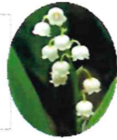
市の花 すずらん 天然記念物 昭和5年11月指定