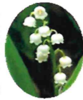
市の花 すずらん 天然記念物 昭和5年11月指定