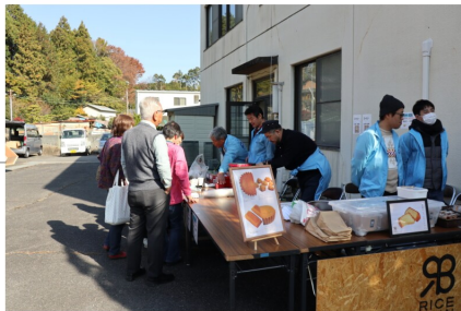
↑次世代部会のシホンケーキコーナー