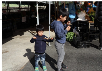
↑焼きたてのアマゴ塩焼き美味しいよ！