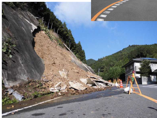
復旧前の崩壊現場

現在は仮復旧が完了して片側一車線道路になっていますが、通行には充分注意しましょう。