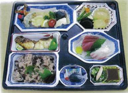
大野敬老会でのお料理