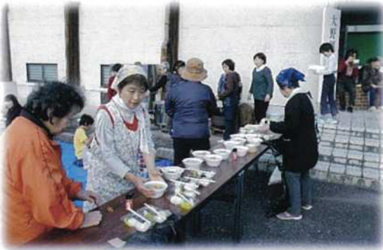
大野運動会での炊き出し