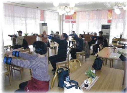
いきいき百歳体操(より道)