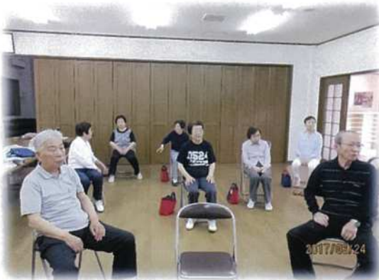
いきいき百歳体操(緑川集会所)