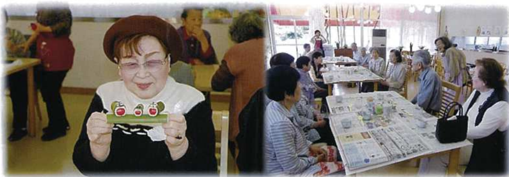
カエルの絵付けを楽しまれています。