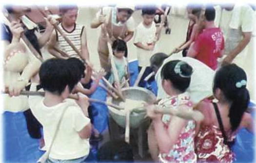
大野ふれあい祭り