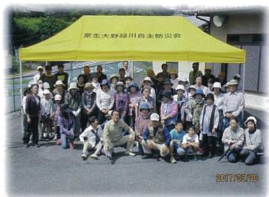
宇陀市地域連携型防災訓練(緑川自主防災会)