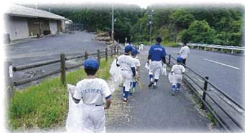
美化奉仕活動 くスポーツ少年団 室生バスターズ