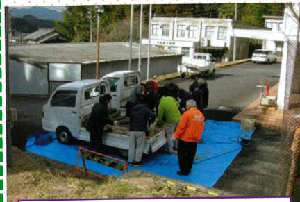
世代間交流会(椎茸植菌)