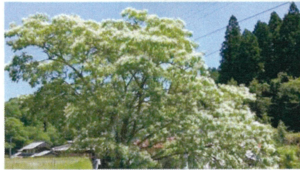
満開の なんじゃもんじゃの木