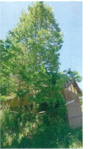
道ばたの ヘラノキ

探訪の後、ヘラノキからは繊維がとれ、昔は綱などを作るのに用いたことや、その木が上龍門地区にはたくさんあり、「とっこ」と呼ばれていたこと。また大蔵寺の文化財や、なつかしい栗野分校の写真などが映され、詳しい説明がありました。