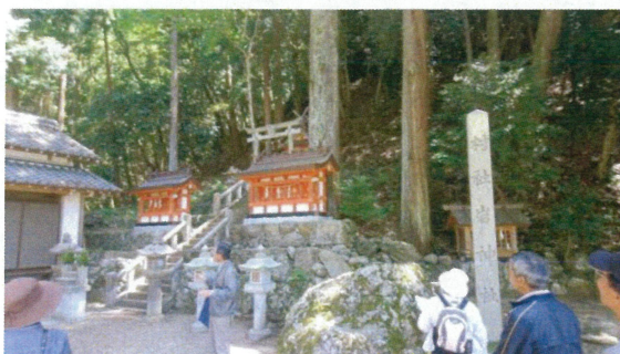
金石寺本尊 十二薬師