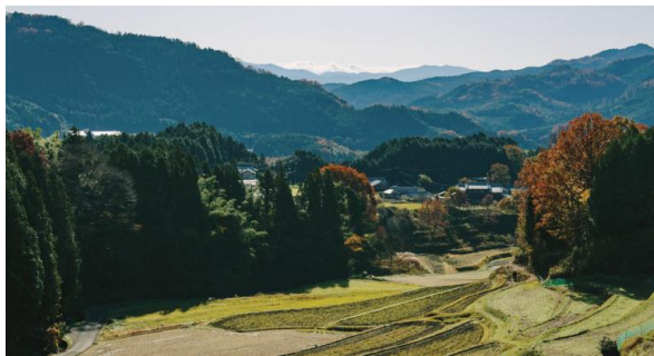
撮影地:宇陀市内の玉立(とうだち)

本事業は、日本古来の里山の資源、地域の繋がり、技術、最先端のテクノロジーを融合し、フードコモンズ(=未来の食のスタンダード)を具現化していく事で未来の暮らしをつくることを目的としています。奥大和の東部地域にあたる宇陀市を玄関口とした大和高原地域において、ロート製薬・奈良県および、宇陀市がパートナーシップを結び、食や農の分野を中心としたプロジェクト(Next Commons Lab 奥大和)を立ち上げる事で起業家を誘致いたします。奥大和の各地で新しいビジネス、産業を創出する拠点をつくり、食や農に関わりながら、地域での新しい共同体・文化を醸成するプロジェクトの事業化を目指します。