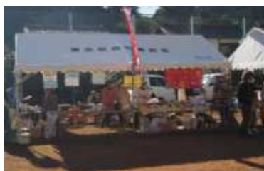
▲昔懐かしい駄菓子屋