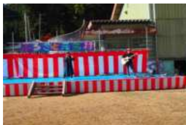
▲室生を拠点とする「根っこ」さん