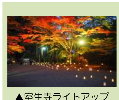
▲室生寺ライトアップ

市ホームページの「催し物案内」や「まちづくり協議会」欄で、ご紹介させていただきます。