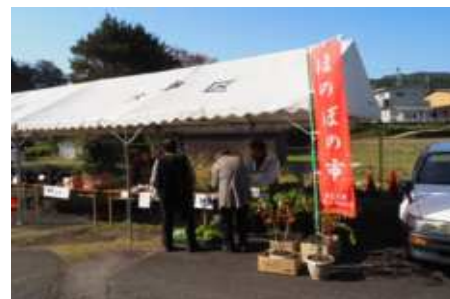
◀ 野菜や観賞植物の展示即売

また、お楽しみランチとして、おでんやカレーライスを廉価で提供しました。チラシ等を見て地域外からも、多くの人々が訪れて交流の輪が広がり1日中賑わいました。