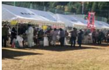
▲各自治会による模擬店