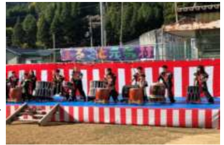
▲室生龍穴太鼓「龍神」の演奏

なお元気村館内では、陶芸や手芸などの作品が展示されていて、元気村のアーティストの作品を自由に見学することができ大いに盛り上がりました。