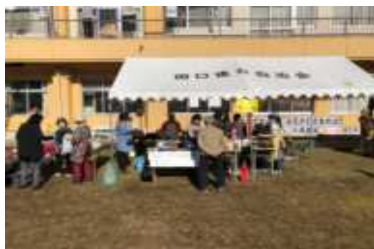
▲室生園からの模擬店