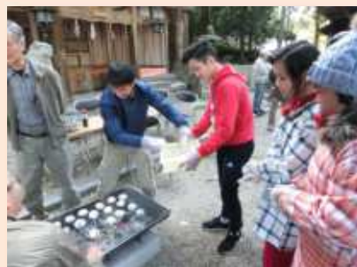
▲炭火で焼いた餅も配ります