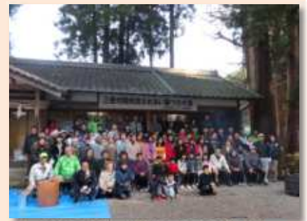
▲参加者みんなで記念撮影

参加した学生からは、踊りや笛の演奏、日本の歌の合唱を披露してもらい、また参加者全員で歌を歌った後、記念撮影もして交流を図りました。