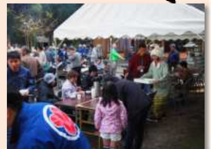
▲楽しい声に包まれた境内