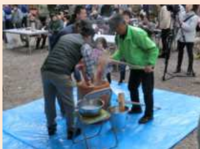
▲いよいよ餅つき開始