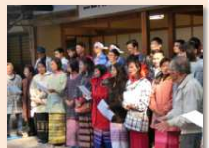
▲みんなで「未来へ」を合唱