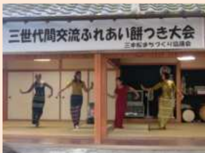
▲故郷のダンスの披露