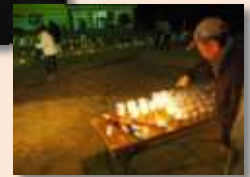
▶ 設置するろうソクに点火