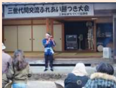
▲法被を着て笛の演奏