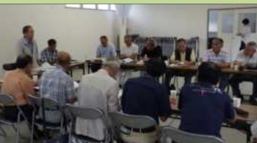
▲7月19日、宮前まちづくり協議会(松阪市)とまめや(多気町)を視察しました。