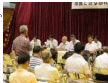
▲7/3 室生地区まち協 市長と語るふれあいトーク