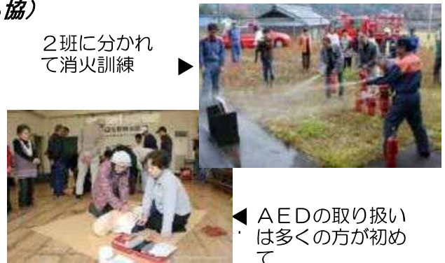
2班に分かれて消火訓練

また、今回の特色として、非常食を試食しました。アルファ米の容器に湯を注ぎますが、量が分かりづらく、「硬い」「軟らかい」など出来上がりを比べ合っていました。