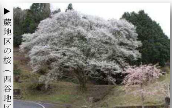
▶ 蕨地区の桜 (西谷地区)