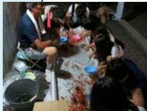
▲8 / 15 室生地区