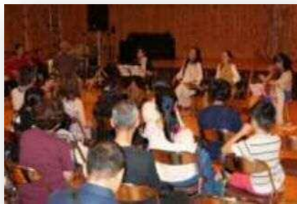
▲古今東西をつなぐ古楽コンサート

多彩な催しの中、音楽舞踊劇では、当まち協から龍神の舞や獅子舞、和太鼓が参加し熱演しました。