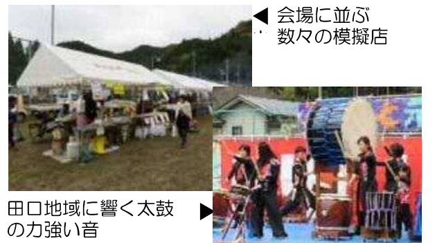
会場に並び数々の模擬店