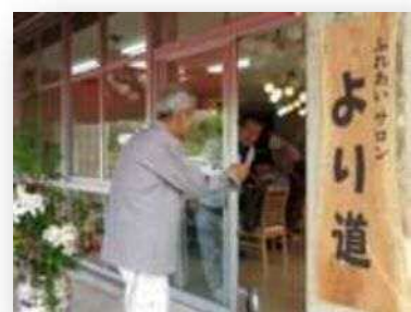
▲さっそく、より道です