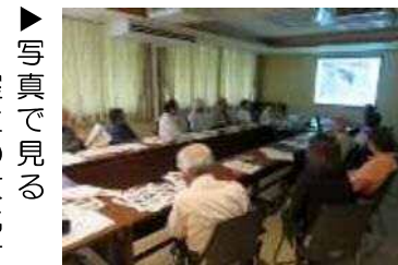
▶写真で見る 室生の文化財

続いて懇談会では、出席者が自慢したい場所や話題、地域資源を活かした交流方法、観光ボランティアガイドの活動などについて話し合いました。