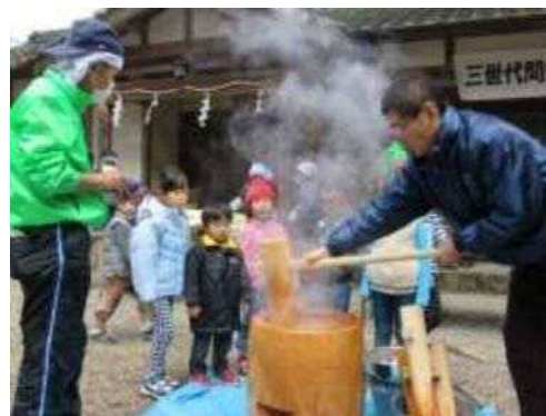
◀ 境内に餅こきの音力響きました

つきあがったお餅は早速振る舞われ、皆さんは、談笑しながらおいしそうにほおばっていました。