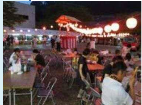
▲8 / 14 三本松