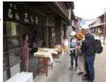
▲お持ち帰りは 饅頭と土産話