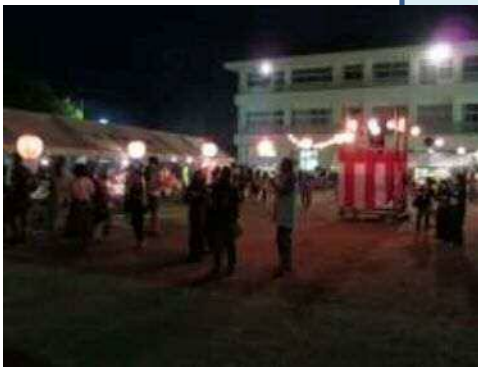
▲8 / 14 笠間地区