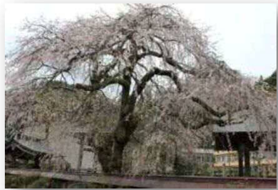
▲ 下田口の枝垂れ桜 (田口地区)