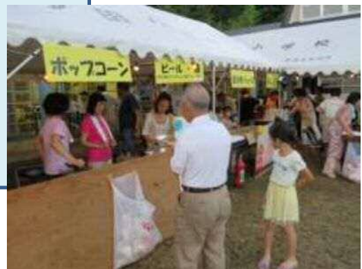
▲8 / 21 多田地区