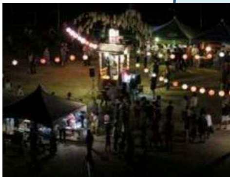
▲8 / 13 向渚地区

8月、各まち協で夏祭りが開催されました。 会場は、多くの笑顔と人であふれ、世代を越えた交流が見られました。