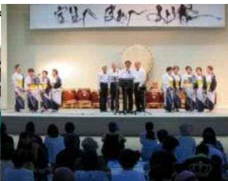
▶フィナーレは大輪の花火