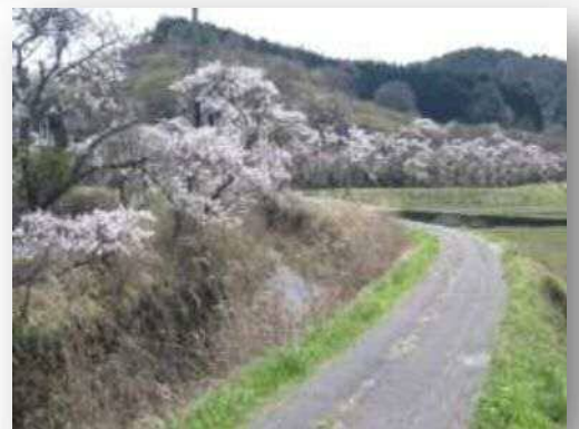
▲ 川沿いの桜 (多田地区)