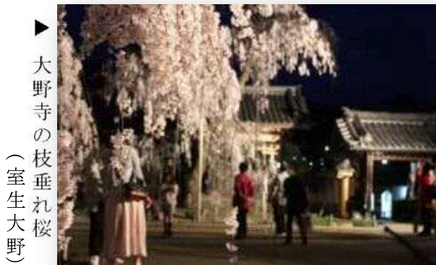
▶ 大野寺の枝垂れ桜 (室生大野)