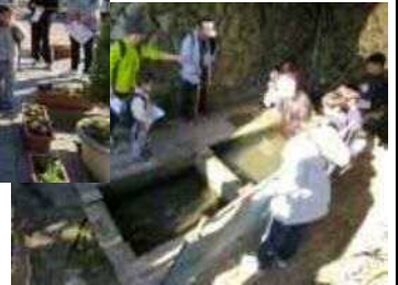
▶ 大切に用てきた井戸は地域の財産