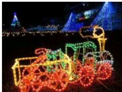
◀ 会場を彩る光の芸術