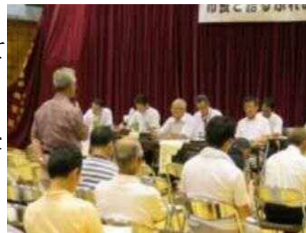
▲出席者から質問も