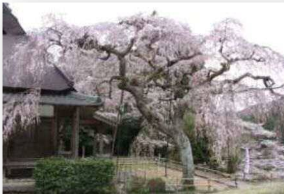
▲ 西光寺の枝垂れ桜 (室生地区)