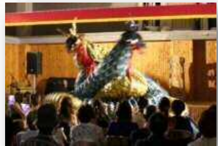
▲舞台上に龍神が登場