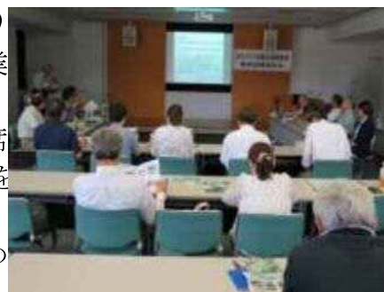
▲報告会に6団体が出席

なお同まち協では、この事業を継続して行っていくため平成28年度も当補助金を受けて、まちづくりを進めています。