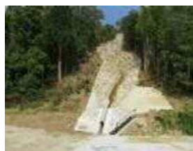
▲山の頂から土砂崩れ