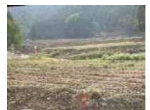
▲畑に栗を植え特産に