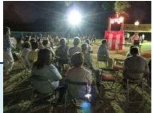
▲8 / 11 西谷地区