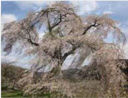
▲ 極楽寺の枝垂れ桜 (笠間地区)

今年は、3月下旬から咲き始め、4月上旬に満開となりました。 来年に向けて、地域自慢の桜が有りましたらご紹介ください。