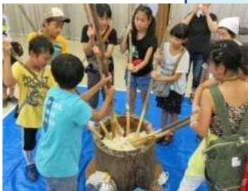
▲8 / 21 室生大野