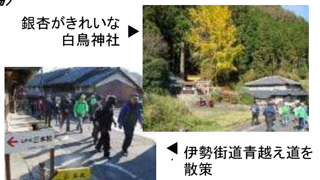
銀杏がきれいな白鳥神社

参加者らは「近くにあるのに、意外と知らない所がたくさんありました」など、散策したコースを振り返っていました。