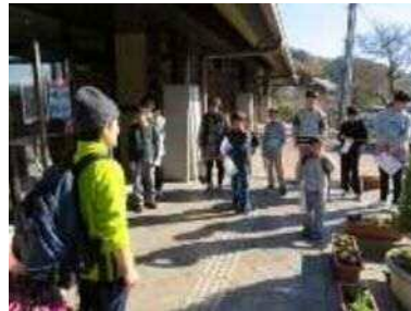
◀ やまびこホールを出発

また、昼食にはお母さん達が調理したカレーライスを味わい、親子の触れ合いがたっぷりの一日となりました。