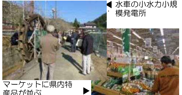
水車の小水力小規模発電所