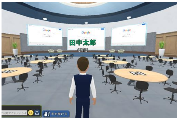
▲カンファレンスホール

※2 メタバースは、コンピュータやコンピュータネットワークの中に構築された、現実世界とは異なる3次元の仮想空間やそのサービス。利用者はオンライン上に構築された3Dの仮想空間にアバター（自分の分身）で参加し、相互にコミュニケーションを取ることが可能。将来的に、買い物や商品の制作や販売といった経済活動を行うことが期待されている。