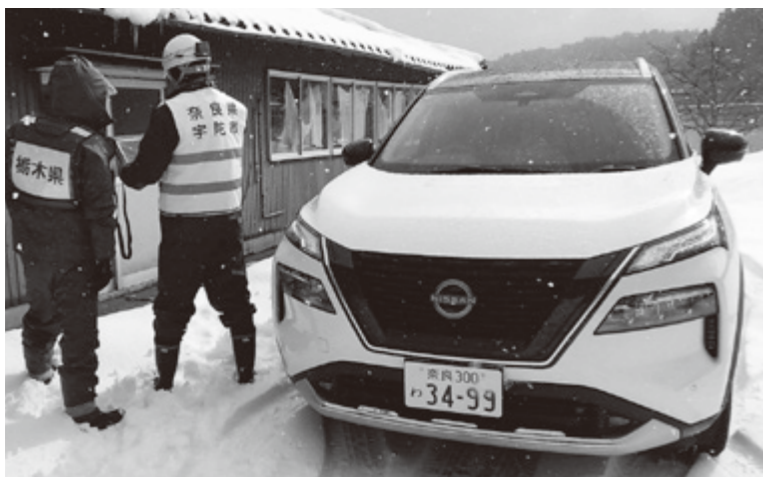
▶現地で移動手段に使用

協定に基づき、奈良日産自動車株式会社から災害派遣車両をご提供頂いております。 災害派遣車両は、今年1月1日に発生した「令和6年能登半島地震」発生に伴う石川県鳳珠郡穴水町（あなみずまち）への災害派遣に活用し、災害現場での被害状況の確認等に役立てています。 （提供車両は「エクストレイル」の四輪駆動モデル1台。スタッドレスタイヤを装着し、悪路にも対応できる災害仕様となっています。）