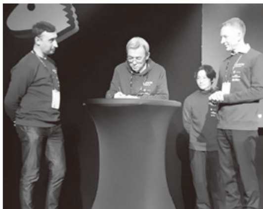
▲エストニアのスタートアップが一堂に会するビジネスフェスティバル「sTARTUp Day」の中で基本合意書締結

○エストニアとは 1991年、旧ソ連から独立後、国の政策として、観光、IT、教育に力を入れ、独立から30年で、IT国家として強固な国となった。アントレプレナーシップ教育に力を入れており、その成果として人口当たりのスタートアップ企業数がEU1位と起業が盛んな国。九州ほどの大きさで、人口は奈良県と同程度。国土の50%が森林で覆われ、4分の1近くが自然保護区。オーガニック農業においては、農地面積の割合がヨーロッパ2位の国であり、SPA、サウナ習慣の歴史も長く、ウエルネスへの関心が高い国である。