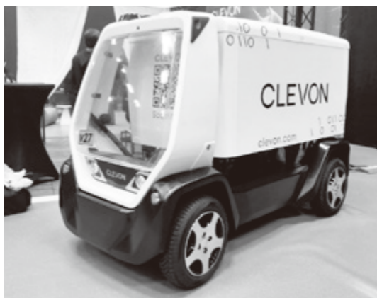
▲クレボンが開発した自律走行配送ロボット