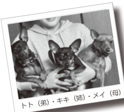
トト(弟)・キキ(姉)・メイ(母)

Q.どんな性格? A. しろ吉・・・人見知りで気の強い性格 お丸・・・人懐っこくマイペースな性格 Q. 家族から一言 A. よく庭に来ていた野良猫2匹を保護。しろ吉は夏に3匹の子どもを産みました。庭に来てくれてありがとう。