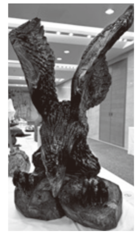
▶もみじ家さんの作品「彫刻」

芸術に対する関心を高め、文化の振興と交流を図るため、第74回奈良県美術展覧会が開催され、次の方が「彫刻」「書芸」「写真」「工芸」において入賞されました。今後、ますますのご活躍をお祈りします。