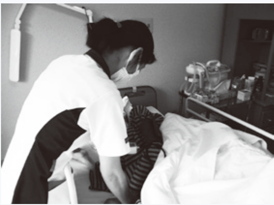
▲バイタルチェックを行う看護師

される「看護」を提供しています。また、看取りのケアも行っており、終末期にある方が亡くなられるまで、できるだけ苦痛なく自然にその人らしく最期をむかえられるように、医師をはじめ多職種とともに利用者さん、家族さんを支援します。