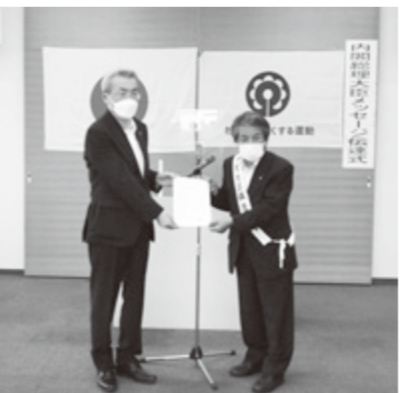
内閣総理大臣メッセージ伝達式 (昨年度の様子)

今年で第73回目を迎える同運動を実施するにあたり、宇陀地区内でも保護司・更生保護女性会が中心となり市民への啓発活動を展開します。