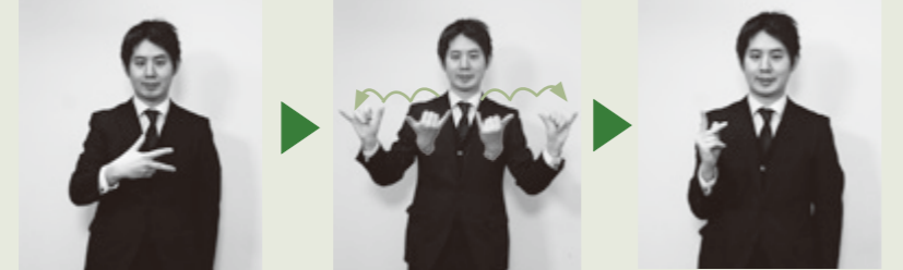
【市民課】右手で「シ」の指文字を表し、2指を立てた両手を左右に半回転させながら引き離し「カ」の指文字を表す。