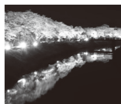
水分桜 (菟田野古市場)

■岩端地区こいのぼりの掲揚 【日時】4月2日~23日(予定) 主催：岩端自治会 ■岩端地区ライトアップ 【日時】3月25日(見頃期間) 午後6時~9時