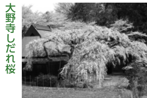
西光寺しだれ桜 (室生)

■大野寺しだれ桜 日本最大級の弥勒磨崖仏を背に、樹齢約300年の小糸しだれ桜と紅しだれ桜が競演