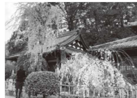
大野寺しだれ桜 (室生大野) ※現在養生中

■佛隆寺千年桜 【日時】4月2日(日) 午前10時~午後2時 雨天中止 【内容】桜の下コンサート・模擬店 【駐車場等】佛隆寺周辺の駐車場が使用不可、内牧グラウンドに臨時駐車場設置。シャトルバス有り(運営協力金必要) 【交通自主規制】午前9時~午後3時(高井バス停から室生地間の区間)