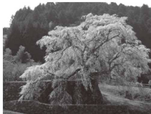
又兵衛桜 (大宇陀本郷)

■宇陀市観光協会 観光課内 (☎82・2457 / IP ☎88・9008) ■平井大師山ライトアップ 【日時】3月25日(見頃期間) 午後6時~9時 ※ライトアップとともにひな形の展示あり 主催：平井自治会・平井大師管理委員会 ■又兵衛桜 戦国武将後藤又兵衛の伝説から名づけられたしだれ桜で、巨木から枝を広げ、堂々と咲き誇る美しい姿は観る人の心を魅了し、感動を与えます。 ※桜まつりはありません。 【駐車場等】有料の個人駐車場をご利用ください。また、桜の近くまで行くには、桜維持保護のための協力金(100円)をいただきます。