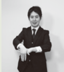
【受付】左手で机を作り、右手で受付表を表す。