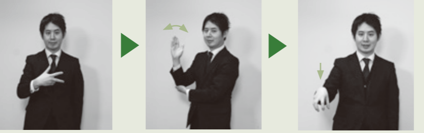
【市役所】右手で「シ」の指文字を表し、左手の平に右ひじをのせ、立てた右手を前後に動かし右手5指を軽く下ろす。