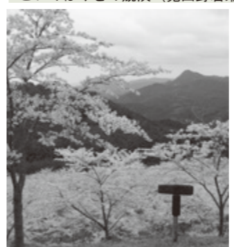
内牧区民の森 (榛原内牧)

■古市場水分桜ライトアップ 【日時】3月25日(見頃期間) 午後6時~9時 主催：宇陀市観光協会 ■菟田野桜ライトアップ 古市場水分桜・岩端桜並木・平井大師山の山桜を美しくライトアップ！