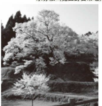
佛隆寺千年桜 (榛原赤埴)

■内牧区民の森の桜 嶽神社周辺に植樹された約500本の桜は、展望台から見るとまるで雲海のように。伊那佐山・額井岳も一望できる絶景スポットです。