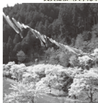
こいのぼりとの競演 (菟田野岩端)

■宇陀市観光協会 観光課内 (☎82・2457 / IP ☎88・9008) ■平井大師山ライトアップ 【日時】3月25日(見頃期間) 午後6時~9時 ※ライトアップとともにひな形の展示あり 主催：平井自治会・平井大師管理委員会 ■又兵衛桜 戦国武将後藤又兵衛の伝説から名づけられたしだれ桜で、巨木から枝を広げ、堂々と咲き誇る美しい姿は観る人の心を魅了し、感動を与えます。 ※桜まつりはありません。 【駐車場等】有料の個人駐車場をご利用ください。また、桜の近くまで行くには、桜維持保護のための協力金(100円)をいただきます。