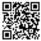
▲動画サイトはこちら

問 桜井宇陀広域連合 総務課 (☎ 0744・47・7070) E-mail: info@sakurai-uda.or.jp URL: https://www.sakurai-uda.or.jp