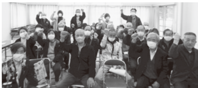
認知症を正しく知ろう!

講座では、認知症の基礎知識や予防方法についてのお話とフレイル予防の体操を行いました。