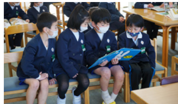
▲図書館からの貸出図書を読む児童