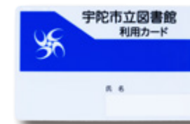
▲図書館利用カード

○市内在住の方、または市内に通勤・通学している方は、どなたでも作っていただけます。氏名や住所などが確認できるもの（運転免許証・健康保険証・学生証・マイナンバーカードなど）と一緒に図書館へ！