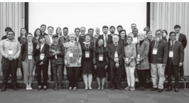
▲学会での研究発表(最後列左から6人目)

に関連する政府からの救済金の相関性をテーマにしています。この研究テーマに関する学術誌を昨年発行し、D1ジャーナル(メディア分野で世界上位10%の影響がある学術誌)に掲載されました。私の研究で、災害の犠牲者が政府からの必要な支援を受けられるようにするためのツールを救済機関などに提供し、人道支援に役立てるようになることを願っています。