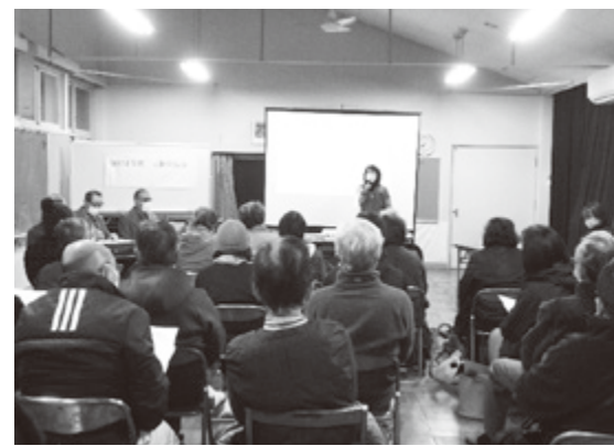
▲講習会を真剣に見入る地域住民の方々

「うだちから」とは、宇陀に由来からある地域コミュニティの力(宇陀力)のこころです。このコーナーでは、市が取り組む「まちづくり」やNPO団体などを紹介します。 問 地域振興課 ☎82・3910/IP☎88・9094