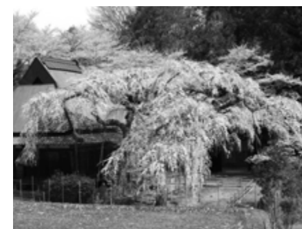
西光寺しだれ桜 (室生)

■西光寺しだれ桜 ライトアップ 室生集落の中腹に大野寺桜の親木といわれる樹齢推定300年のしだれ桜が鎮座。開花期間中ライトアップ(午後9時まで) 主催：室生地区まち協