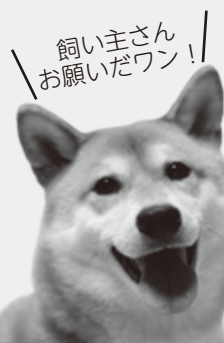
飼い主さん！ お願いだワン！