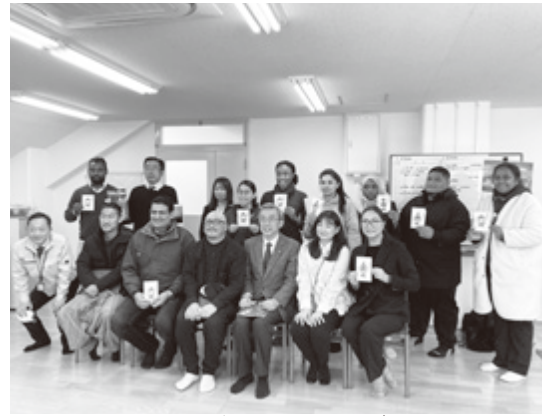
▲みんなでハイ、チーズ

2月21日、JICA(国際協力機構)の研修プログラムで日本滞在中の皆さんに宇陀をご案内しました。エジプト、モンゴル、タジキスタン、カンボジア、ツバル、エチオピア