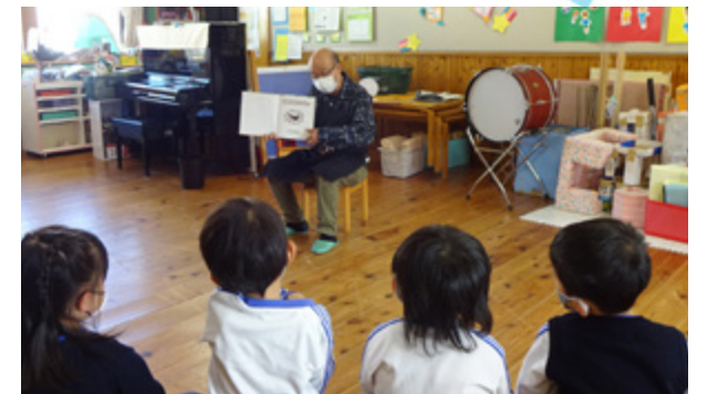
▲図書館職員によるおはなし会 幼稚園や保育園、こども園等にも出向いたりします。

子どもたちに絵本に出合う機会をつくるため、原則、第2・第4の水・土曜日に中央図書館、第3土曜日に大宇陀図書館でボランティア団体や図書館職員が絵本の読み聞かせをしています。