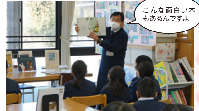
▲菟田野小学校でのブックトーク