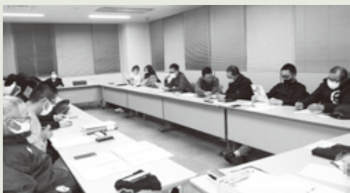
▲スポーツ推進委員会議の様子

1月の会議では、市スポーツ協会事業の「うたのを歩こう2023」、「宇陀シティマラソン」の協力、次年度開催の「レクリエーションボッチャ・モルックの体験会」について話し合いました。体験会は5月14日(日)に開催します。ボッチャ・モルックは、誰でも気軽に楽しめるニュースポーツですので、皆さん、お越しください。[詳細は27ページをご覧ください。]