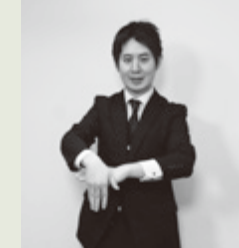
【受付】左手で机を作り、右手で受付表を表す。