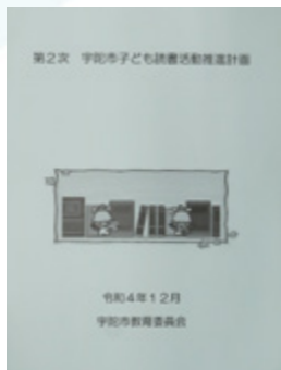
▲市ホームページで公開しています

回っています。しかし、この割合は、小学校4年生では約82%あったのに対し、中学1年生では約71・6%まで下がっています。学年が上がるにつれ、テレビゲームやインターネット、スマホなどの利用が増え、子どもの興味や関心が多様化していることが考えられます。 この状況を踏まえて、図書館では子どもたちにたくさん本と出会っていただくため、様々な取り組みを行い、子どもたちの成長に応じた読書活動ができる環境づくりを家庭・地域・学校等と一緒に進めていきます。