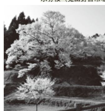
佛隆寺千年桜 (榛原赤埴)

■内牧区民の森の桜 嶽神社周辺に植樹された約500本の桜は、展望台から見るとまるで雲海のように。伊那佐山・額井岳も一望できる絶景スポットです。