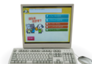
▲資料検索用パソコン