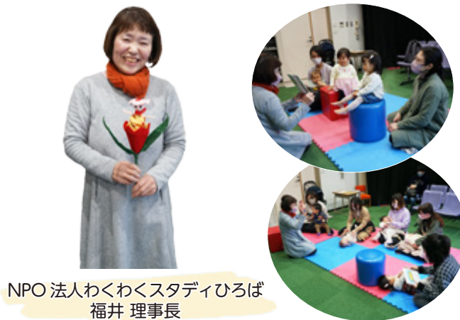
NPO法人わくわくスタディひろば 福井 理事長

月に2回（第2・4水曜日）、中央図書館のおはなしの部屋で絵本の読み聞かせやわらべ歌で体遊びのボランティアをしています。0～3歳までのお子さんを対象に、本や体遊びを通じて、元気ですくすく育ってくださることを願って開催しています。おはなしの部屋では自由に過ごしていただいで大丈夫ですので、お気軽にお越しください。