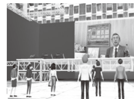
▲メタバース空間の雰囲気