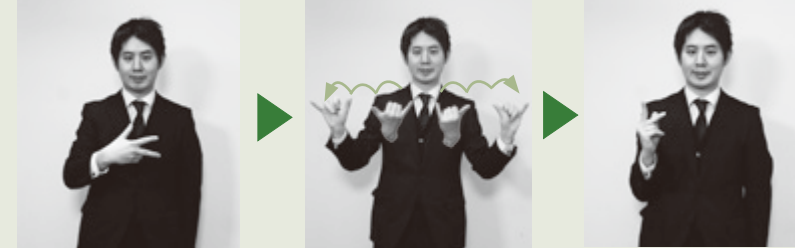
【市民課】右手で「シ」の指文字を表し、2指を立てた両手を左右に半回転させながら引き離し「カ」の指文字を表す。