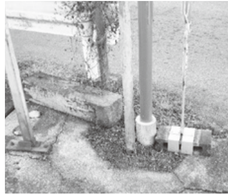
▲道標が倒されている!!

令和3年8月中頃、地域住民より「近鉄室生口大野駅南側の四つ辻にあった道標が倒されている」との報告があり、当初より「当まち協で修復できないものか」と事業検討をしてみました。