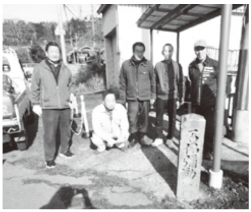
▲元どおりに修復できました。

当時、道標は根元から折れており修復が難しい状態でしたが、折れた部分の両面を精密に測りながら、芯となる2本の鉄棒を刺し合せて接着しました。