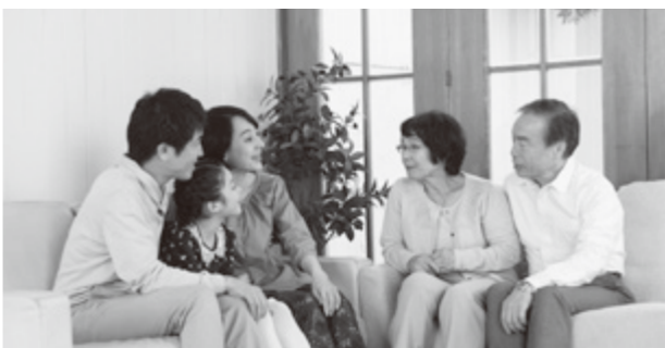
活動には守秘義務が課されており、個人情報や プライバシーの保護に配慮した支援活動を行っ ています。

住み慣れた地域でずっと安心し て暮らしていけるように、皆さん の立場で親身になって相談に応じ たり、心配ごとを解決するため、 いろいろな福祉サービスを紹介し たり、必要に応じて役所など関係 機関との調整役に努めます。