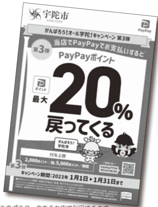
このポスターのあるお店で利用できます