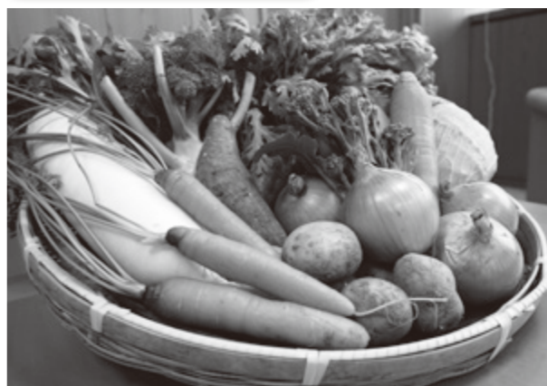
▲市内で収穫された美味しい有機野菜