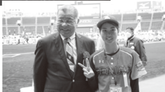
▶始球式を務めた掛布さんと田中さん