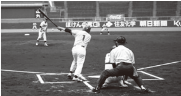
▶年齢に負けない、はつらつとしたプレーが繰り広げられました。

宇陀市では、「還暦野球のまち」として、還暦野球を中心としたまちおこしを全国に拡げるための広域的な活動に取り組んでおり、本大会も今年で6回目の開催となりました。