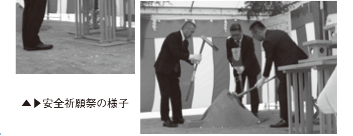
▲安全祈願祭の様子