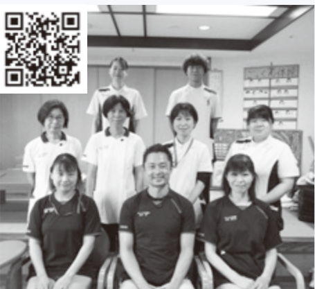
▲明るいスタッフ一同お待ちしております！

デイケアでは、理学療法士や作業療法士といった専門職による「機能の維持回復訓練」や「日常生活動作訓練」を1対1で受ける事ができます。