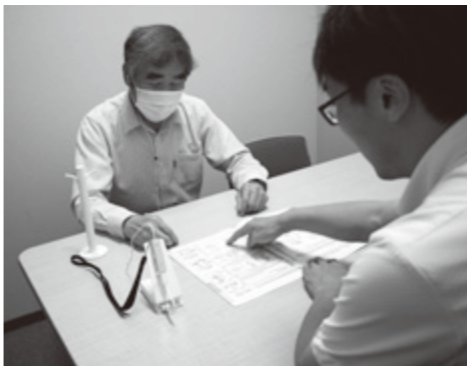
▲実際に耳に乗せて使用しているところ

の軽減が図れることで来庁者の方が安心して窓口に来ていただけるよう住民サービスの向上に努めます。