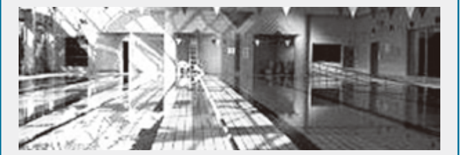
問 宇陀市屋内温水プール (☎82・2200/IP88・9106)

【場所】室内温水プール(アクア・グリーン榛原) 【対象】市内在住の中学生以下の園児・生徒・児童 ※小学校3年生以下のお子さんは、保護者の付添いが必要(対象者1人につき付添い保護者1人無料) ※付添いの保護者も水着、水泳帽を着用 ※期間中荒天(警報発令時)の場合中止とさせていただきます。