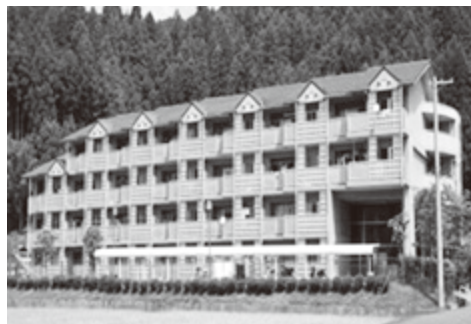
▲公営住宅 笠神団地