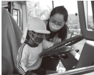
③クラクションをプッシュ!!