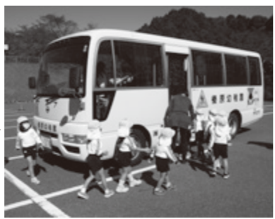
②バスに乗り込みます