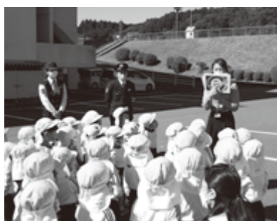
①クラクションの位置確認

バスに閉じ込められるなどの緊急時のときだけ、「助けて!!」と大きい声を出して誰かに気付いてもらえるまでクラクションを鳴らすと説明を受けました。その