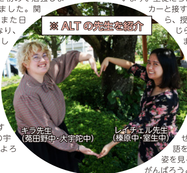
キラ先生 (菟田野中・大宇陀中)

宇陀市でこれからもっと教員の経験をしたいと思っています。大学で心理学を勉強したので、困っている子どもたちに教えてあげたいです。休みの日はアニメカフェに行くことや裁縫をするのが好きです。これからの宇陀市の生活が楽しみです。よろしくをお願いします。