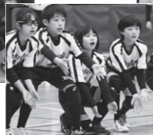
▲試合中キャッチの体勢をとる光希さん(右から2番目)