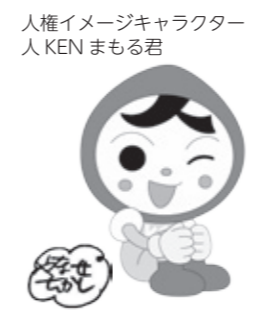
人権イメージキャラクター 人KEN まもる君