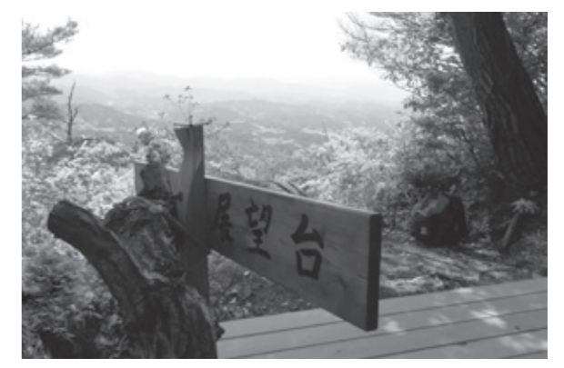
▲整備した天狗岩展望台にて

しかし、登山道に設置された古い道標の年月が経ってかなり傷んでいたため、当まち協のスタッフで道標の交換と整備を行いました。更に頂上手前にある天狗岩展望台も雑木が伸びて見晴らしが悪いため、所有者の許可を得て、雑木の整備をしました。天狗岩からの大パノラマは日本百名山に選ばれた大峰山等の山々を見渡すことができ、休憩場所としても適しているため、ベンチの設置も行いました。