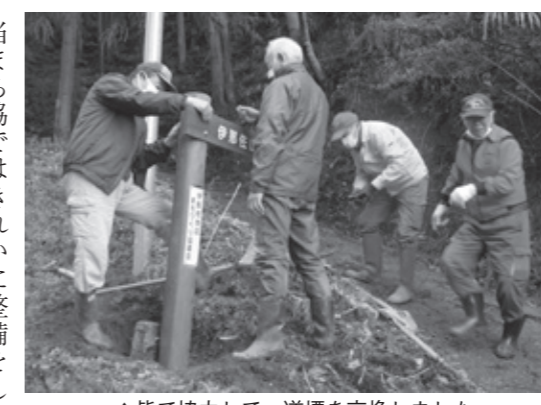
▲皆で協力して、道標を交換しました

気軽に登れる歴史深い里山、伊那佐山(637m)は現在も信仰の山として、山頂には「都賀那岐神社」が建てられています。また、神武東遷の時に詠んだといわれる歌碑も建てられていて、近年はハイキングで多くの方が訪れています。 一昨年、登山者用に作った旧伊那佐文化センター脇の駐車場も徐々に知る方が多くなり、登山者の方に良く利用をして頂いています。