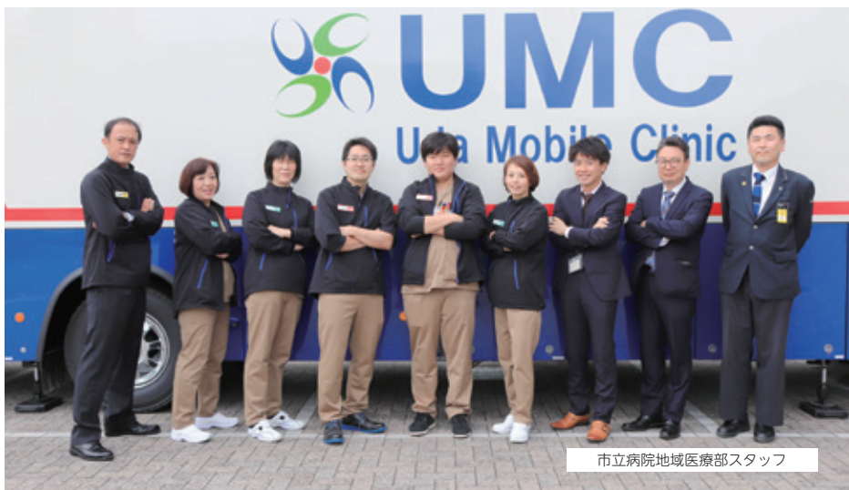
市立病院地域医療部スタッフ