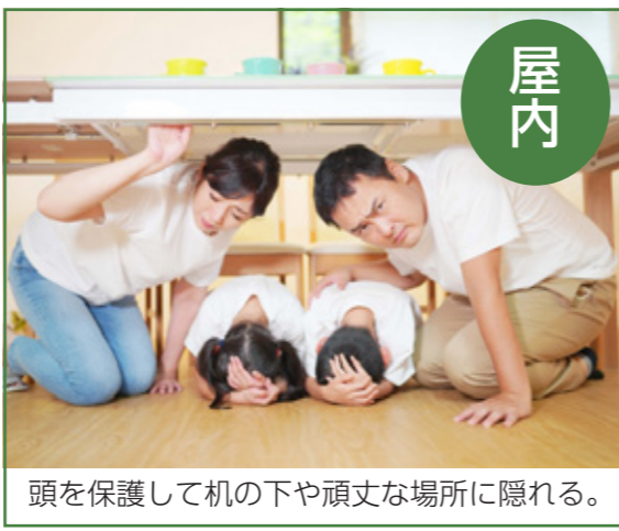
頭を保護して机の下や頑丈な場所に隠れる。