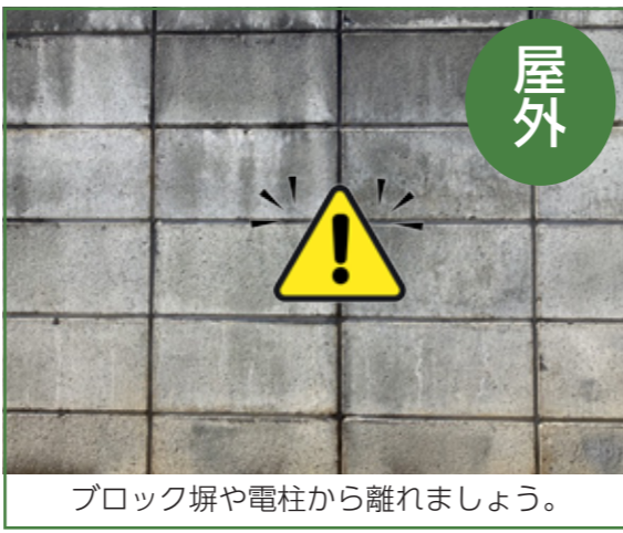
ブロック塀や電柱から離れましょう。