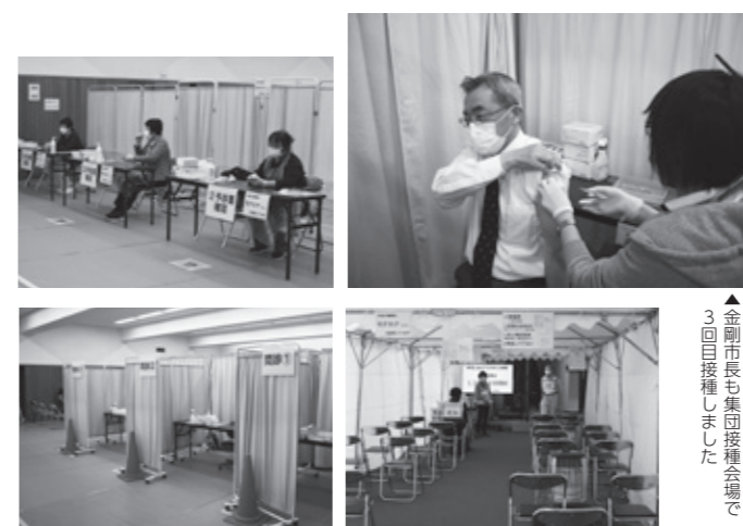
▲金剛市長も集団接種会場で3回目接種しました