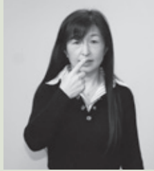
【私】右人差し指で自分を指す