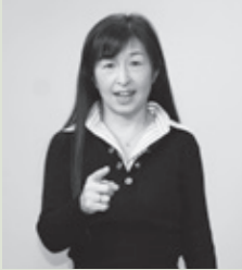
【あなた】右人差し指で相手を指す