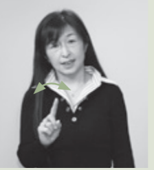
【何】右人差し指を立て、左右に振る(尋ねるときは首をかしげる)