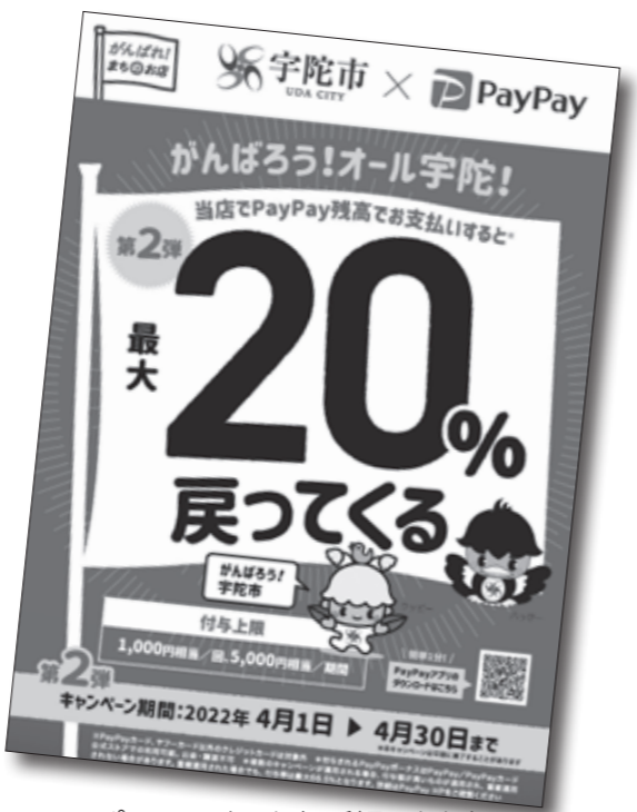
このポスターのあるお店で利用できます

※ただし、市役所や公共施設、病院や介護施設、調剤薬局、公共サービスなど一部の店舗や商品は対象外となります。 トラブルを避けるため、事前に店頭等で確認をお願いします。