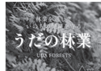
【4月1日公開】 サイト名: うだの林業