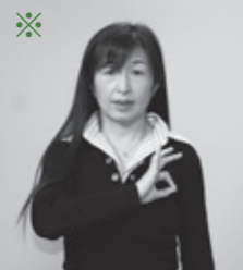
【名前】右手の2指で作った輪を左胸に当てる