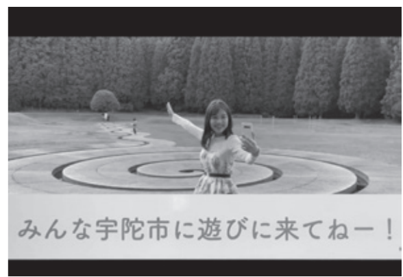
みんな宇陀市に遊びに来てねー!