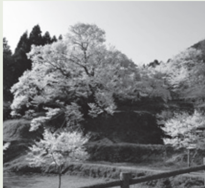
佛隆寺千年桜(榛原赤埴)

門前の樹齢推定900年を超える千年桜。開花中はライトアップ!(午後9時まで) 主催：宇陀市観光協会 ※花見会はありません