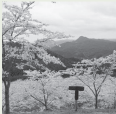
内牧区民の森(榛原内牧)

嶽神社周辺に植樹された約500本の桜は、展望台から見るとまるで雲海のように。伊那佐山・額井岳も一望できる絶景スポットです。