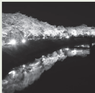
水分桜(菟田野古市場)

古市場水分桜・岩端桜並木・平井大師山の山桜を美しくライトアップ! 主催：宇陀市観光協会