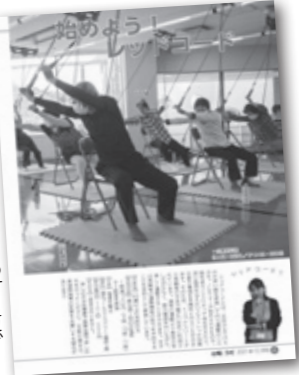
広報うだ12月号で紹介しています