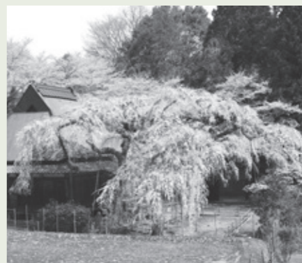
西光寺しだれ桜(室生)

室生集落の中腹に大野寺桜の親木といわれる樹齢推定300年のしだれ桜が鎮座。開花期間中ライトアップ(午後9時まで) 主催：室生地区まち協