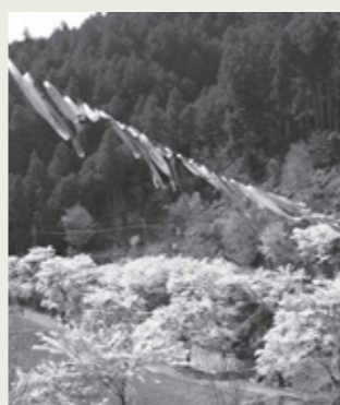
こいのぼりとの競演(菟田野岩端)