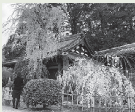
大野寺しだれ桜(室生大野) ※現在養生中