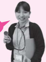
医療介護あんしんセンター 山田

冬場の高齢者に多いです。家の中の温度差に気をつけ、ヒートショックを防ぎましょう!