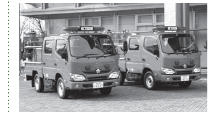
▲新しく更新整備された車両