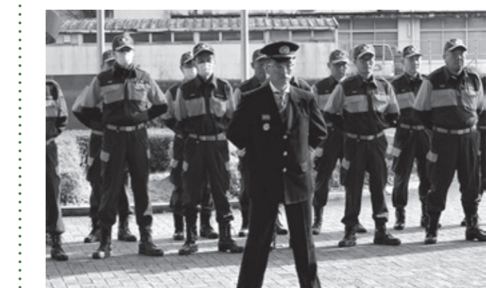
▲消防車両等引渡式の様子

引渡式終了後、火災予防を呼びかける出発式が行われ、4地域を管轄する各分団が宇陀消防署とともに、市民に火災予防を呼びかけました。