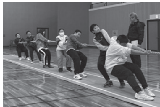
■各競技種目および開催日

○募集人数が半数未満のときは、開講しない場合があります。 ○開講日は諸都合により、やむを得ず変更する場合があります。 ○教材費などが別途必要な講座・教室がありますので、事前にご確認ください。