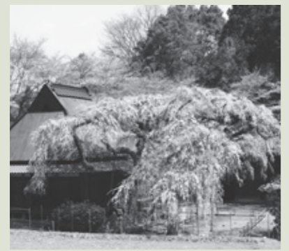
西光寺枝垂れ桜（室生）

室生集落の中腹に大野寺桜の親木といわれる樹齢300年の枝垂れ桜が鎮座 【期間】3月末～見頃期間 午後9時まで