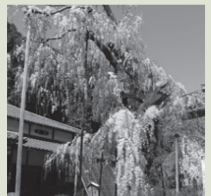
大野寺枝垂れ桜（室生大野）※現在養生中

日本最大級の弥勒磨崖仏を背に、樹齢約300年の小糸枝垂れ桜と紅枝垂れ桜が競演 【期間】3月末～見頃期間 午後9時まで