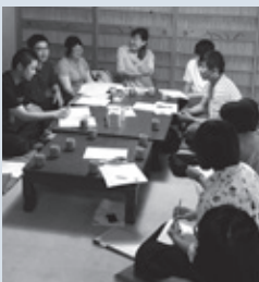
普段の活動は報恩寺のHPでご覧いただけます http://houonji.net/

宇 陀には、人を受け入れる土壌があると思います。私が目指すのは、来訪者にとって、それぞれの実家的な居場所をここに作る。一人ひとりの来訪者に丁寧に接することで人との関係性が生まれ、それに縛られるのではなくユルユルつながり続けられ、その実現も夢ではないと思います。これからの仲間とともに、そんなまちづくりがデザインできればと願っています。