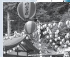
夏祭りでの、たくさんの子どもたちを見ると気が出ますね

現在進行中の宿泊施設誘致事業が、その最たるものではないかと思えます。これは市民福祉の増進に寄与すると同時に、市の地域資源を活用して広く誘客を図るものです。多くの方々に観光やスポーツツーリズムなど、市内を巡って四季を感じていた、そんな夢の実現に向けてこれからも進んでいきます。