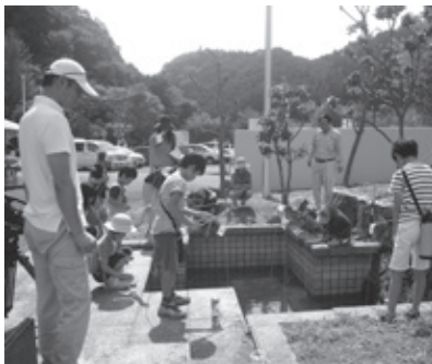
▲毎年人気のザリガニつり

問 水道局 下水道課 ☎82・5627 問 宇陀川浄化センター ☎82・5725