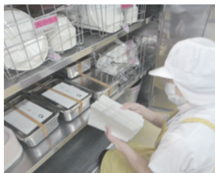
今回はお雑煮解説のプリントを一緒にお届け