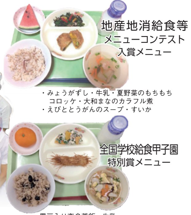
地産地消給食等 メニューコンテスト 入賞メニュー

私たちの給食を食べた子ど もたちが、心身ともに健全に 育って、郷土の思い出と食事 に込められた多くの人たちの 「気持ち」を胸に明るい未来 の社会を担ってくださることを 願っています。