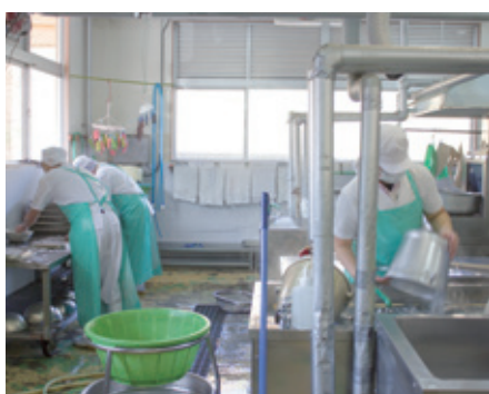
調理後は明日に向けて後片付け