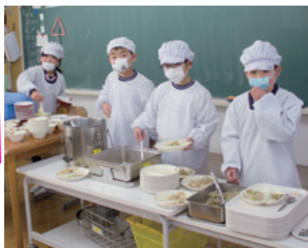
学校では給食当番さんが盛り付け