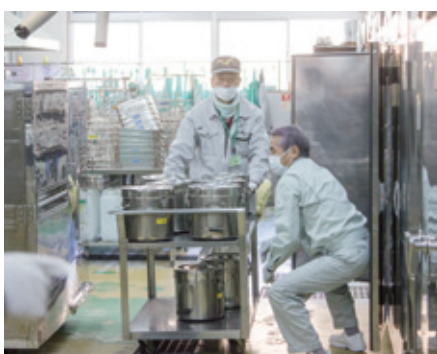
学校毎のコンテナに仕分け