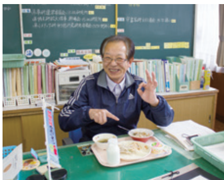
校長先生による検食もOK