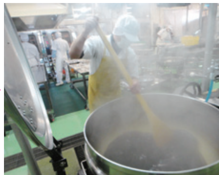
魚のタレを絶妙な美味しさまで煮込む