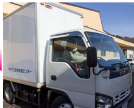
安全運転でアツアツの給食をお届け