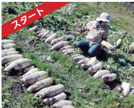
市内で採れた新鮮野菜