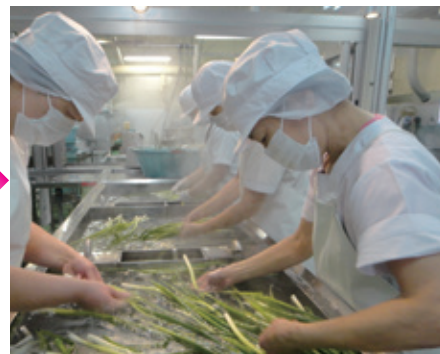
3層のシンクで野菜は3回洗い