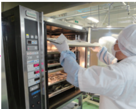
魚はオーブンで焼き上げます