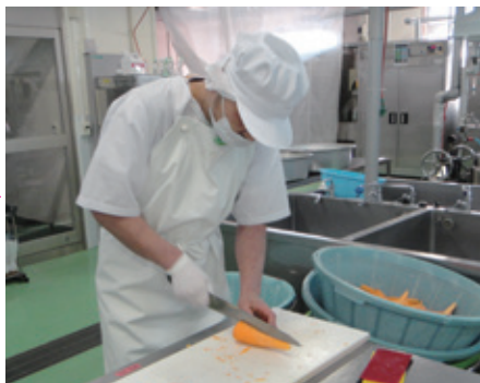
野菜の皮むきや大まかなカットは手作業