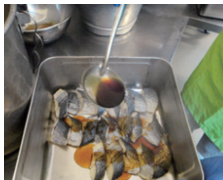
タレはこだわりの手作り