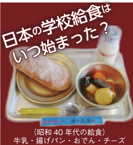
(昭和40年代の給食) 牛乳・揚げパン・おでん・チーズ