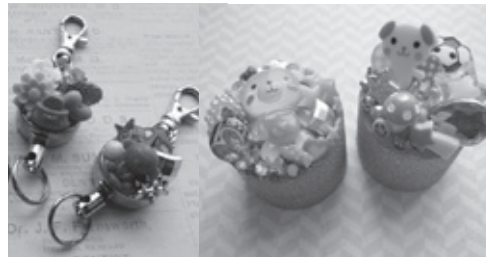
リールキーホルダー・ペットボトルキャップ (いずれか1つ作成)

中央公民館 ☎ 83・0551/IP ☎ 88・9180 【休館日】 木曜日・祝日