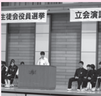
当日は選挙制度の説明に始まり、各立候補者と応援演説、投票事務の説明、そして実際の投票が行われました。

問 選挙管理委員会事務局(総務課内) (☎82・1302/IP ☎88・9068)