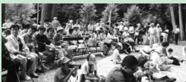
龍王ヶ淵で開催の「飛行機(蝶)トンボと水辺の音楽会」の様子(8月5日)