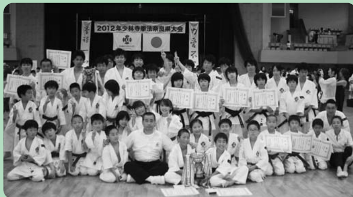
少林寺拳法 大王クラブ（奈良市中央体育館にて）

〔団体の部〕 緑帯以下チーム(5位)、茶黒帯チーム(4位)、一般有段チーム(5位)