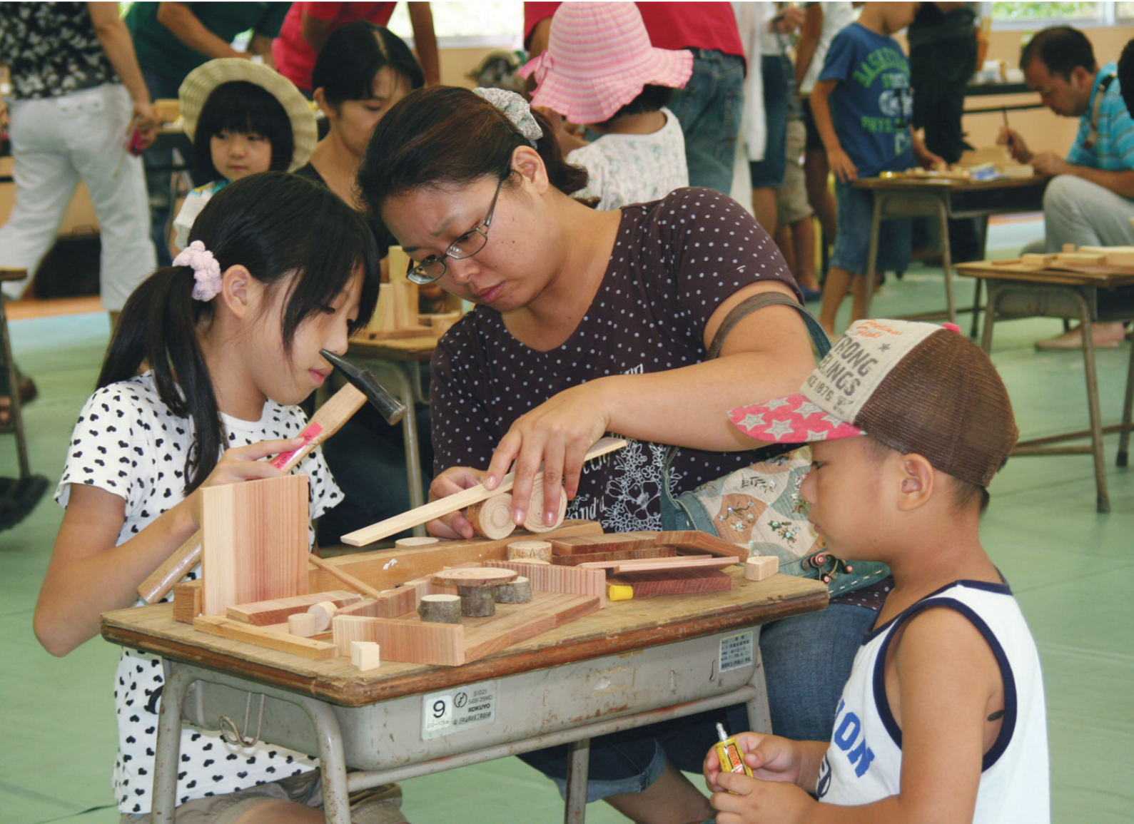
木工教室で真剣に作品を作る親子 (8月5日 平成榛原子供のもり公園で撮影)