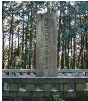
高倉山にある顕彰碑

神武天皇が登ったという「高倉山」は、大宇陀守道と大東との間にある高倉山にあてる説が有力ですが、東吉野村の高見山とする説もあります。八十梟帥がいた「国見丘」には諸説がありますが、桜井市と宇陀市との境にそびえる山とも考えられています。「女坂」は桜井