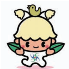
【マスコットキャラクター】 ウッピー