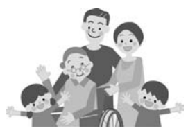
【人権オリジナルキャラクター】 「てんいち先生・ひかりちゃん」 作画：坂口郁夫さん

社会を支え続けた、高齢者の方々に感謝し、敬意、また高齢者の方たちの真の姿を理解し、高齢者から子どもまですべての人々が、いきいきと暮らせる社会の実現に向けて努力しましょう。