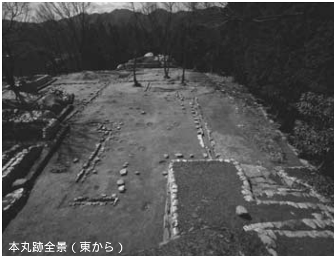
本丸跡全景（東から）

宇陀松山城跡は、4月に重要伝統的建造物群保存地区に選定された大宇陀区松山地区の東側にそびえる「古城山」一帯に位置する中世から近世初頭にかけての城跡です。