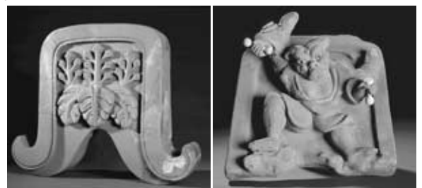
本丸跡出土の瓦 右：雷神鬼瓦 左：桐紋鬼瓦

城跡は、標高約470mの古城山の山頂を中心に広がり、その中心部はすべて高石垣で築かれています。中央には天守郭と本丸が東西に連なり、本丸上には本丸御殿が建っていました。本丸の周囲は、石垣に沿って瓦葺の多門櫓が囲ってあります。複雑な構造の虎口（出入口）と大規模な門をもち、城へ通じる大手道は