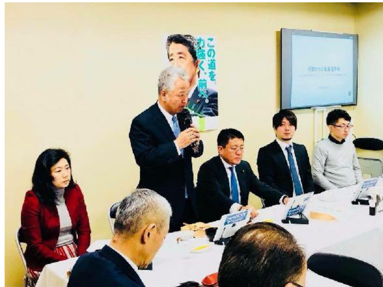
政府へのIT化戦略のご提言

日本の電子契約市場の立ち上がりを支え、政府へのIT化戦略のご提言を始めとし、電子契約の普及とともに、事業を成長させてきました。