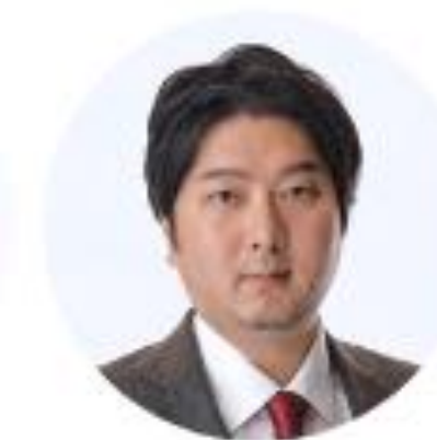
取締役 クラウドサイン事業責任者 弁護士