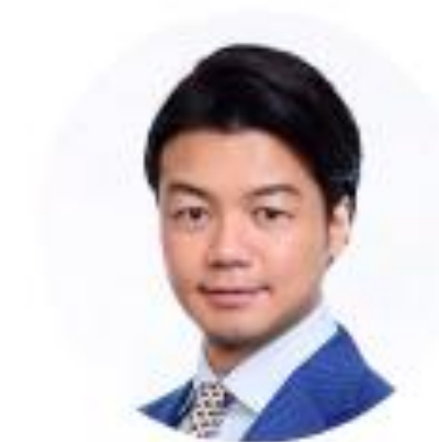
創業者 代表取締役社長 弁護士