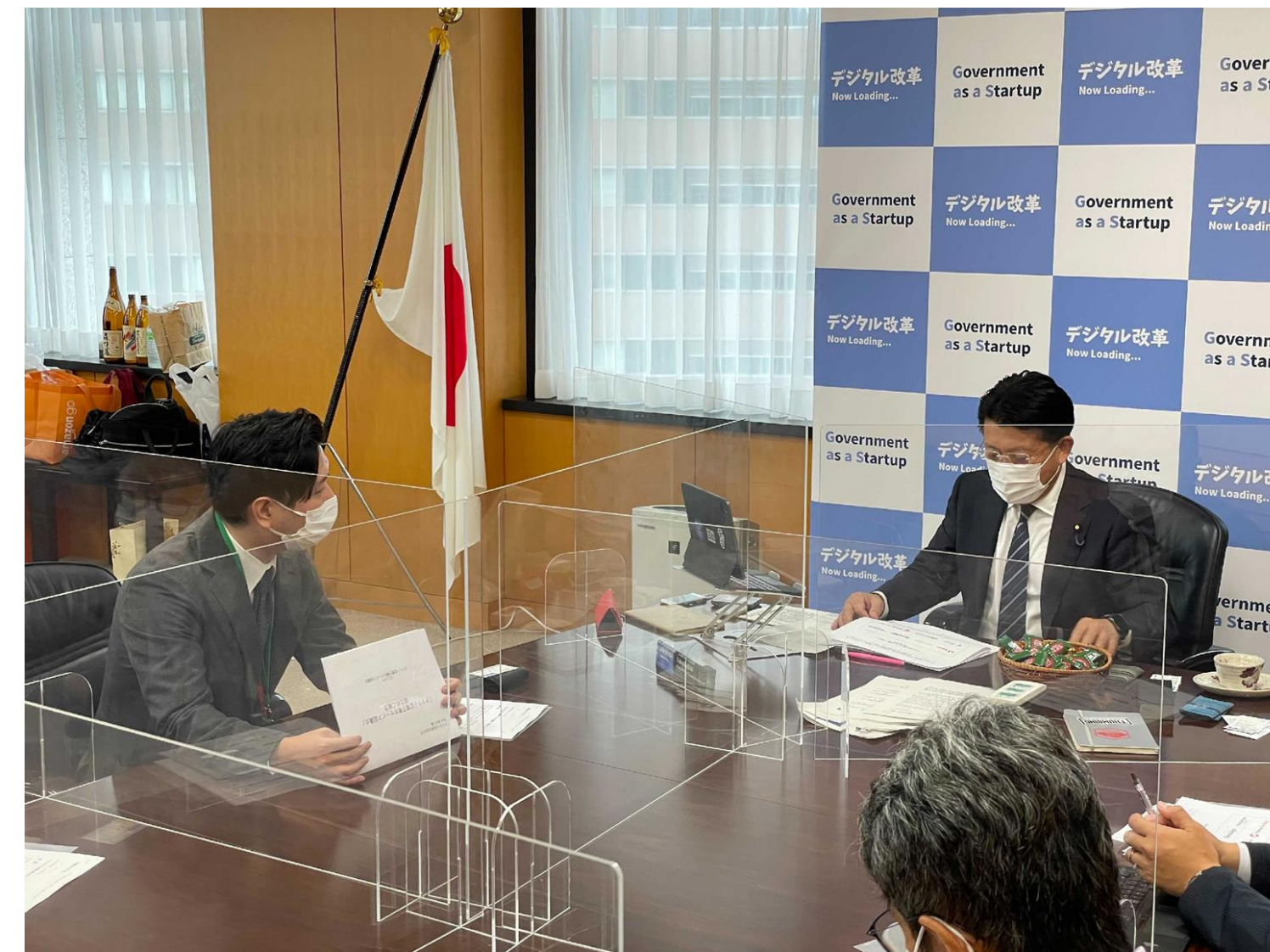
クラウド型電子署名サービス協議会の設立