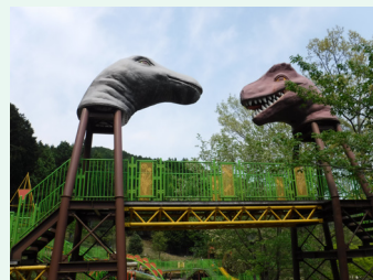
キャンプやバーベキューも可能な平成榛原子供のもり公園