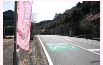
榛原榛見が丘に設置のキッズゾーン