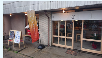
空き家を改修し起業