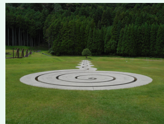
来園者が増加している室生山上公園芸術の森