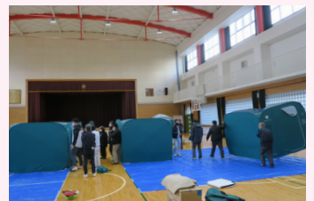
避難所開設に備えた訓練