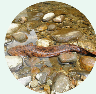
オオサンショウウオ