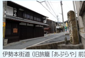
伊勢本街道（旧旅籠「あぶらや」前）