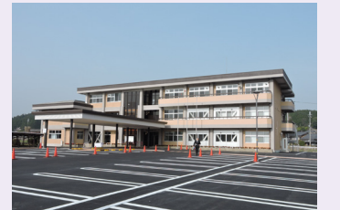
人権と福祉の拠点施設「宇陀市人権交流センター」