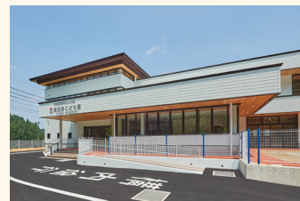
2020年に整備した菟田野こども園