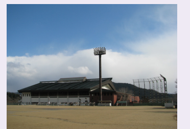
宇陀市総合体育館と総合運動場