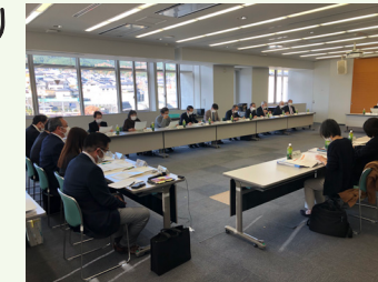
様々な意見が出た総合計画審議会