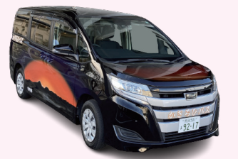
かざろひをデザインした 大宇陀南部地域ボランティア有償バス