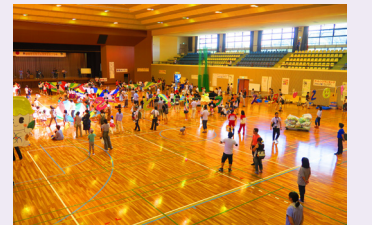
子どもフェスタの様子