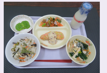
全国学校給食甲子園での献立