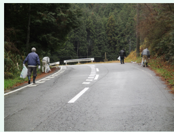
道路沿いの清掃活動