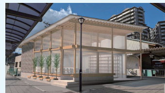
榛原駅前に整備の交流施設（イメージ）