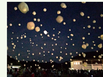
市民団体により行われたスカイランタンフェスティバル