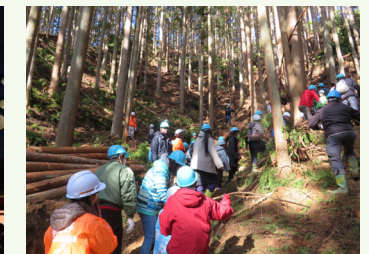
菟田野まちづくり協会による林業体験