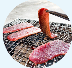
処理したジビエを調理