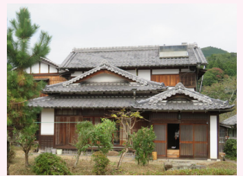
宇陀の魅力体験施設の外觀