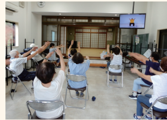
各地域で行っている 「いきいき百歳体操」