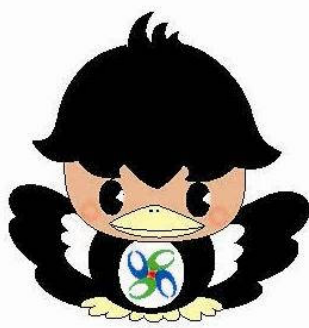
宇陀市記紀・万葉マスコットキャラクター「ハッピー」

2012年、『古事記』(712年)が完成してから1300年の年に、宇陀市は記紀・万葉として観光振興を目的にプロジェクトを立ち上げました。『ハ(や)っぴー』は八咫鳥をイメージした宇陀市の案内役です。