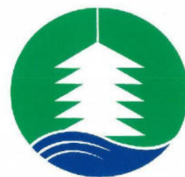
宇陀市シンボルマーク

2012年、『古事記』(712年)が完成してから1300年の年に、宇陀市は記紀・万葉として観光振興を目的にプロジェクトを立ち上げました。『ハ(や)っぴー』は八咫鳥をイメージした宇陀市の案内役です。