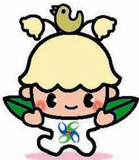
宇陀市マスコットキャラクター「ウッピー」

宇陀市の花「すずらん」の妖精で、頭には、宇陀市の鳥「うぐいす」を乗せ、市章の入った服を着ています。