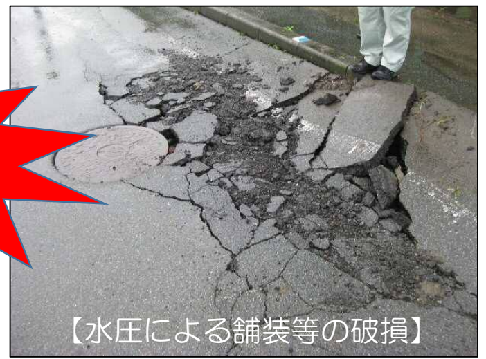
【水圧による舗装等の破損】