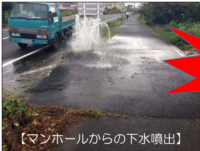
【マンホールからの下水噴出】

【原因】 雨水を流す雨樋などの排水が、「污水管」につながれていることや雨天時に汚水ますの蓋を開けて宅内の雨水を排水していること等が原因です。